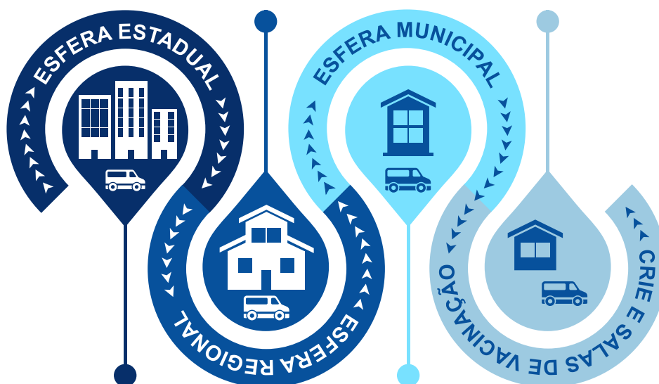
Figura 1: Desenho da rede de distribuição de imunobiológicos no estado de Pernambuco

A investigação tem como objetivo monitorar a transmissão do vírus na ilha e fornecer evidências para orientar as ações de vigilância, sobretudo aquelas direcionadas ao apoio das retomadas das atividades sociais econômicas em segurança. Atualmente, o estudo encontra-se na quarta fase e possui previsão de término em maio de 2021. A expectativa dos pesquisadores envolvidos é que a população esteja protegida na fase para também favorecer a análise de efetividade e memória imunológica adquirida com a vacinação.