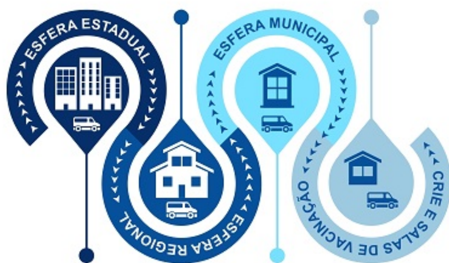
Figura 1: Desenho da rede de distribuição de imunobiológicos no estado de Pernambuco

A investigação tem como objetivo monitorar a transmissão do vírus na ilha e fornecer evidências para orientar as ações de vigilância, sobretudo aquelas direcionadas ao apoio das retomadas das atividades sociais econômicas em segurança. Atualmente, o estudo encontra-se na quarta fase e possui de previsão de término em maio de 2021. A expectativa dos pesquisadores envolvidos é que a população esteja protegida na última fase para também favorecer a análise de efetividade e memória imunológica adquirida com o advento da vacinação.